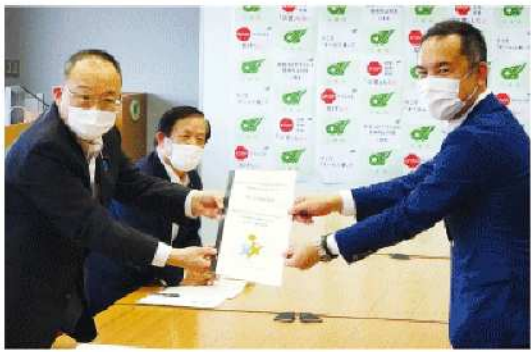
自由民主党三重県支部連合会を訪問し、鈴木英敬知事らと新型コロナウイルス感染症の拡大防止と、三重県経済の再興に向けた緊急提言を行った。

自由民主党三重県支部連合会 新型コロナウイルス感染症の拡大防止 経済復興へ知事に緊急提言